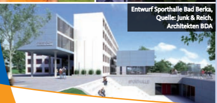
Entwurf Sporthalle Bad Berka, Quelle: Junk & Reich, Architekten BDA