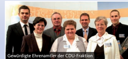
Gewürdigte Ehrenamtler der CDU-Fraktion

... für meinen Wahlkreis. Diese wunderbare Region erstreckt sich vom Nordwesten über das südliche Weimarer Land bis in den Norden des Landkreises Saalfeld-Rudolstadt. Mein ländlich geprägter Wahlkreis zeichnet sich durch eine Vielfalt an kulturellen und wirtschaftlichen Angeboten aus. Zahlreiche Schlösser, Burgen, Kirchen und Museen laden zur geschichtlichen Entdeckungsreise ein. Die von uns ins Leben gerufene Thüringer Landgemeinde ist eine große Chance im Nebeneinander von Einheitsgemeinde und Verwaltungsgemeinschaft dies zu bewahren. Sie verbindet effiziente Strukturen der Gemeinden mit Gestaltungsspielräumen für die örtliche