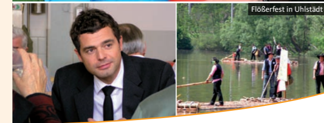
Flößerverein in Uhlstädt