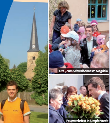
Feuerwehrfest in Umpferstedt