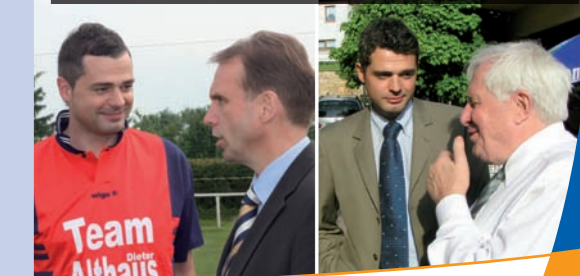
Im engen Kontakt mit Dieter Althaus und Bernhard Vogel.