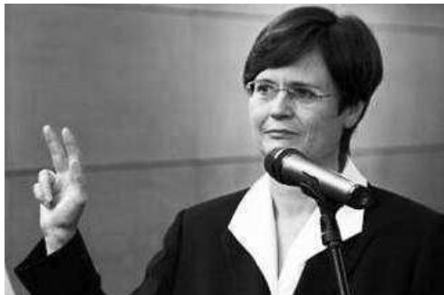
30.10.2009: Christine Lieberknecht bei ihrer Vereidigung zur Ministerpräsidentin.

Weiter erklärte die Ministerpräsidentin: „Mehr Demokratie, mehr Bürgerfreundlichkeit und mehr Transparenz sind Grundlagen unserer Politik. Dies gilt nicht nur für die ersten hundert Tage der neuen Landesregierung, dies gilt für die gesamte Legislatur. Nur so werden wir erfolgreich sein und unsere politischen Ziele erreichen. Wir werden den Freistaat weiter voran bringen.“