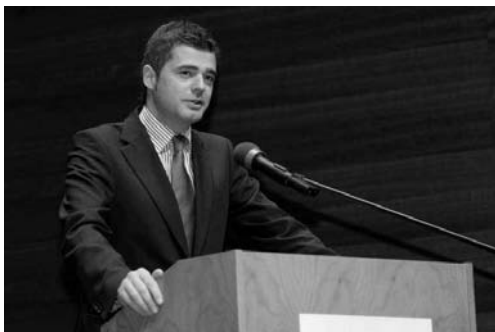
Der Vorsitzende der CDU-Fraktion im Thüringer Landtag Mike Mohring setzt sich für die Thüringer Kleingärtner ein.

Wie auf einer Sitzung des Stadtrates Apolda schon angekündigt, hat die CDU-Landtagsfraktion auf Vorschlag von Mike Mohring für eine Änderung der Pflanzenabfallverordnung gestimmt. Bei der Grünabfallverbrennung wird es zukünftig wieder keine zeitlichen und örtlichen Vorgaben des Landes mehr geben. Darauf machte der CDU-Fraktionsvorsitzende Mike Mohring aufmerksam, nachdem sich die CDU-Landtagsfraktion gemeinsam mit dem Minister für Landwirtschaft, Forsten, Umwelt und Naturschutz auf eine entsprechende Novellierung der Thüringer Verordnung über die Beseitigung von pflanzlichen Abfällen geeinigt hat. „Die CDU-Landtagsfraktion hat einstimmig ein Votum zur Änderung der jetzigen Verordnung abgegeben. Danach werden die örtlichen und zeitlichen Begrenzungen, dass nur außerhalb von Ortsteilen und innerhalb von März/April und Oktober/November verbrannt werden darf, aufgehoben. Wir haben damit die vielen Anregungen der Thüringer Kleingärtner aufgegriffen und setzen diese nun um“, sagte Mohring. An Sonntagen und gesetzlichen Feiertagen sei das Verbrennen jedoch weiter unzulässig. Der Fraktionsvorsitzende wies darauf hin, dass die Grünabfallverbrennung im Ermessen der Landkreise liegt.