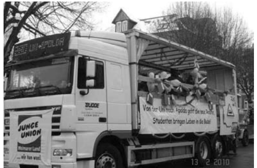
13.02.2010: Die Junge Union Weimarer Land aktiv dabei beim Apoldaer Faschingsumzug.

Studenten durch, die großen Anklang fand. Wenn die Rahmenbedingungen geschaffen sind, kann man den Studenten nur einen Tipp geben: "Apolle? - Hinein!".