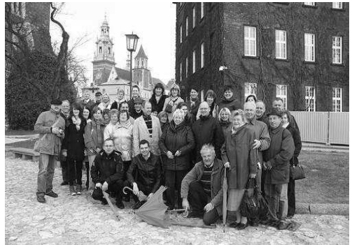
28.03.2010: Krakau ist immer eine Reise Wert - die CDU Weimarer Land vor dem Wawel.