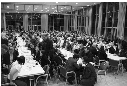
Ausverkauftes Haus im Conference Center in Bad Sulza - Bier und Hering sorgten für eine ausgelassene Bierzeltstimmung.