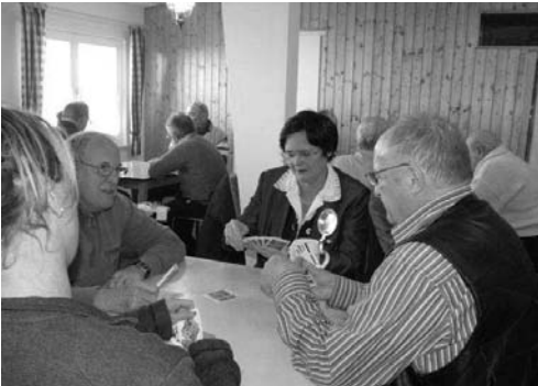
07.03.2010: Beim Skat in Willerstedt ließ sich niemand in die Karten schauen.