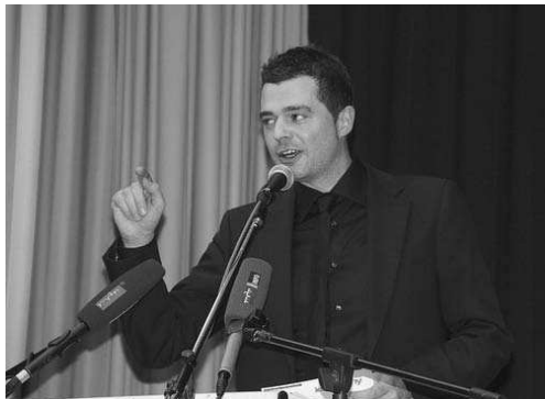
17.02.2010: Der Kreisvorsitzende Mike Mohring mit Witz und Charme in der Bütt'.