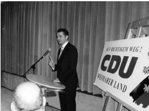
09.01.2010: Der CDU Kreisvorsitzende Mike Mohring bei seiner Neujahrsansprache.