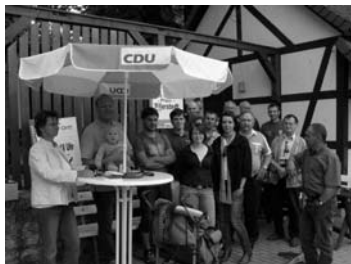
Vor Ort in Willerstedt.