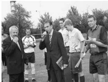
Fußball II: Team Althaus zu Gast in Umpferstedt