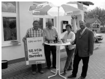
Vor Ort in Obertrebra.

„CDU Vor Ort“ - Insgesamt in 70 Orten war die CDU Weimarer Land während der Kommunalwahl mit ihren Infoständen vertreten.