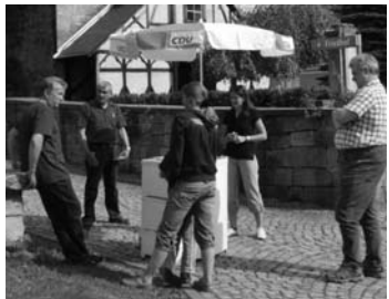
Vor Ort in Tonndorf.