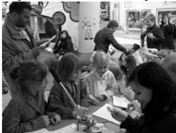
Viel Spaß an der Mal- und Bastelstraße.