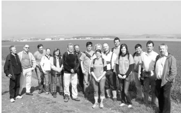
24.05.2008: Auf dem Weg von Umpferstedt nach Frankendorf mit Blick ins Weimarer Land.