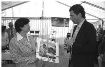
07.05.2008: Kreisvorsitzender Mike Mohring gratuliert der Jubilarin und überreicht als Erinnerung einen übergroßen Steuerbierdeckel.