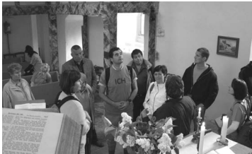
23.05.2008: In Hetschburg wurde Geld durch Trödelmärkte für die Sanierung der Kirche gesammelt.