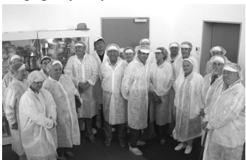
09.07.2008: Mehr als 20 Mitglieder der Senioren Union Weimarer Land trafen sich in der Apoldaer GUTENA Nahrungsmittel GmbH zu einer Betriebsbesichtigung.