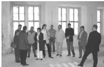
03.07.2007: Über den baulichen Fortgang der Grundsanierung des Schlosses Ettersburg haben sich die Mitglieder des OV Nordkreis informiert.