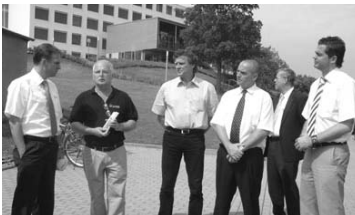
11.06.2007: Ministerpräsident Dieter Althaus (I.) informierte sich im Rahmen seiner Kreisbereisung über den Schul- und Vereinssport in Bad Berka und besichtigte die Sporthalle am Marie-Curie-Gymnasium.