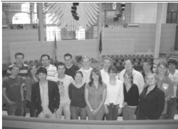
Die JU im Plenarsaal des Deutschen Bundestages.

Unter: www.demokratie-mitmachen.de findet man zahlreiche Informationen zum Thema Demokratie