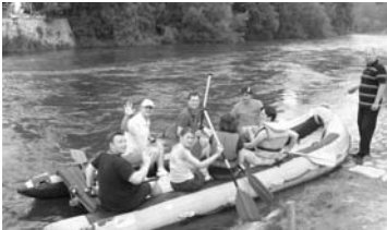
26.08.2007: Fraktionsmitglieder immer mit dabei.

alle, die hofften mit der Neuordnung der Gesellschafteranteile kehre endlich Ruhe in die EGW ein und Kreiswerke können Realität werden.