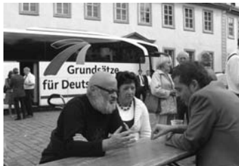
17.08.2007: Vor der Kulisse des Goethe-Hauses in Weimar nutzten Mitglieder und Freunde die zweite Station der Dialogtour zu Gesprächen.