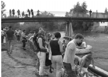
26.08.2007: Großer Anhang herrschte an der Bootsanlegestelle am Saale-Ufer in Camburg beim Einsetzen der neun Schlauchboote und einem Floß.