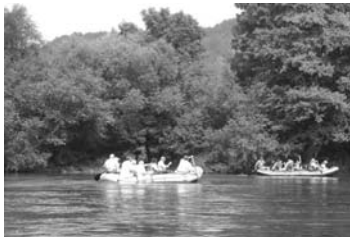
Nach anstrengender Flussfahrt kamen alle 100 Teilnehmer wohlbehalten in Bad Kösen im Gasthaus „Schloß Saaleck“ an. Noch mehr Bilder: www.cdu-weimarerland.de .

(vh) Im kommenden Jahr findet der 16. Politische Aschermittwoch bereits am 6. Februar 2008, um 17:00 Uhr, im Bad Sulzaer Conference Center an der Therme statt. Die Mitglieder und Freunde sollten recht frühzeitig ihre Karten zum traditionellen Heringessen des CDU Kreisverbandes Weimarer Land bestellen. Zum traditionellen Neujahrsempfang wird am 12. Januar 2008 in das Apoldaer Schloss eingeladen.