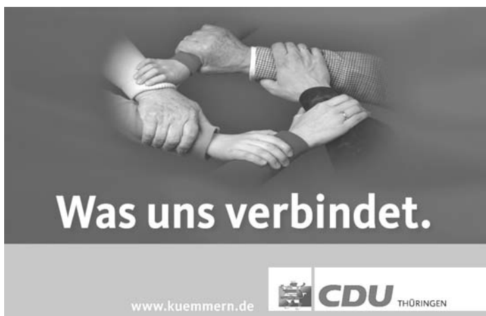
02.12.2006: Der Entwurf des Grundsatzprogramms „Was uns verbindet.“ ist auch in der CDU-Kreisgeschäftsstelle in Apolda erhältlich.