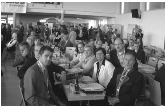
02.12.2006: Die Delegierten der CDU Weimarer Land zeigten Geschlossenheit auf dem 21. Landesparteitag in Dermbach.