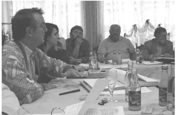
Ein umfangreiches Programm hatten die Mitglieder der CDU-Kreistagsfraktion zur Haushaltsklausur am 10. und 11.11.2006 in Kolkwitz zu absolvieren.

In den Beratungen zum Haushaltentwurf 2007 konnte die Fraktion den Schließungsplänen des Landrates nicht folgen. Vielmehr verständigten sich die Fraktionsmitglieder einstimmig darauf, dass die über die Kreisgrenzen hinaus bekannte Einrichtung in der Mitte des Landkreises auch von diesem weiter betrieben werden soll. „Das Schullandheim ist ein anerkanntes Thüringer Schullandheim und als Lernort außerhalb der Schule hoch beliebt“, so der Fraktionschef Mike Mohring. Mit dem Änderungsantrag soll neben dem Fortbestand der