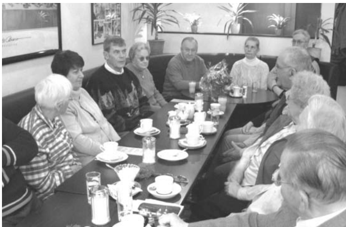
12.12.2006: Zum Jahresabschluss trafen sich die Mitglieder der Senioren-Union in Bad Berka in gemütlicher Runde bei Kaffee und Kuchen.